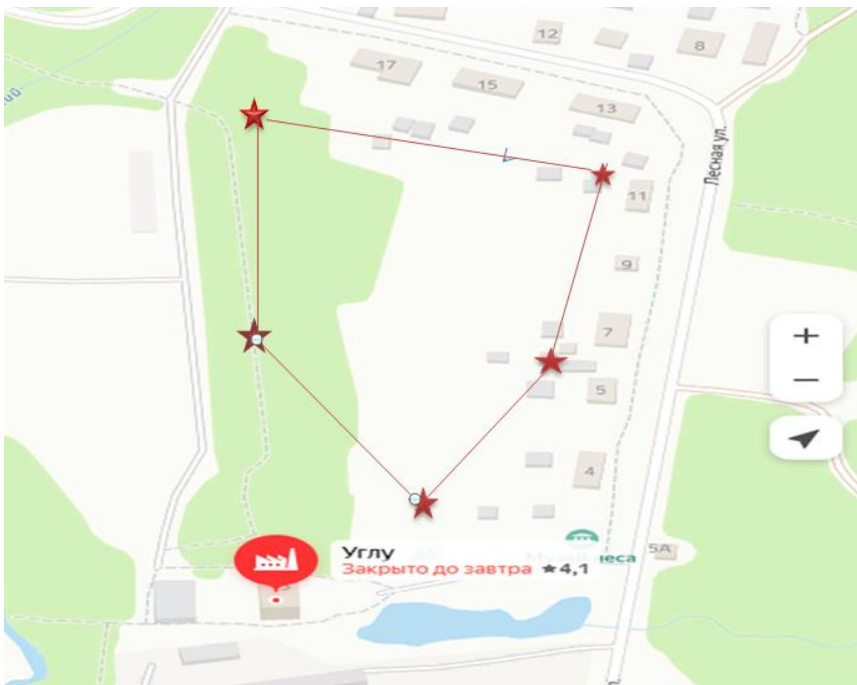
Схема размещения учебного (геодезического) полигона на территории ФГБОУ ВО УГЛТУ